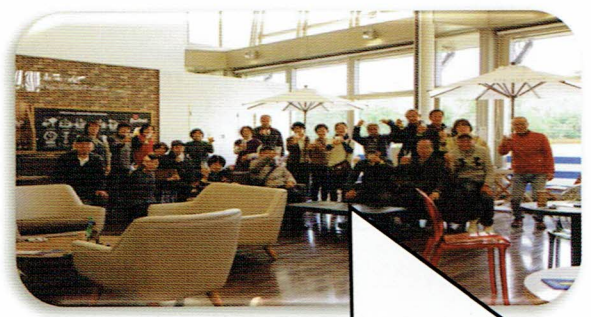
ビール片手に和気あいあいで写真撮影