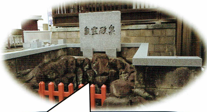
泉殿宮内の「泉殿霊泉」同じ水脈を利用してのアサヒビールを醸造