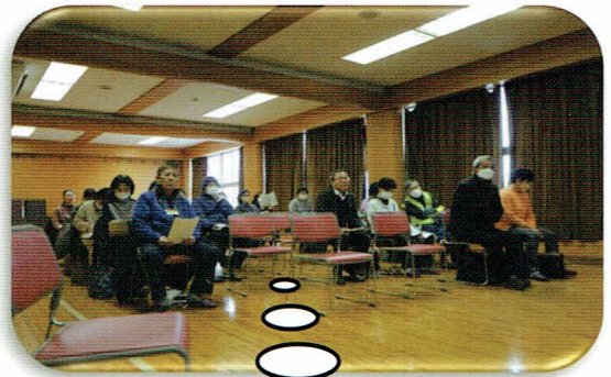
真剣に聞き入る皆 さん！