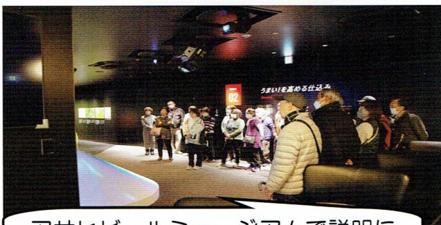
アサヒビールミュージアムで説明に聞き入る皆さん。