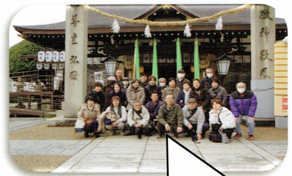
泉殿宮内で皆さんと写真撮影