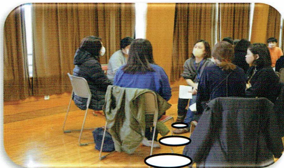
グループに分かれての ディスカッション風景