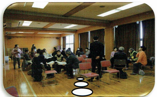
最後に皆さんとの 意見交換会