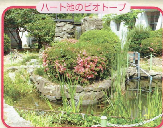
ハート池のビオトープ

学校内にあるハート池やすくすく農園、またアクアユートピアを含め、地域の自然を活かした事業の取り組みを発表し、近代化が進む中でも、昔の地域の生活・憩い・遊び場だった川や田園風景等の四季折々の自然を、子ども達が身近に観察や体験・体感ができ、授業でも活用されるといった地域ぐるみでの環境づくりが評価されました。