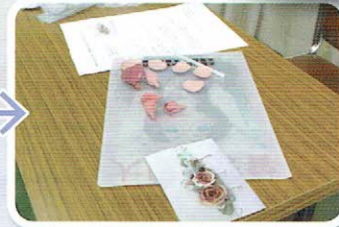
まずバラの花びらを 作ります