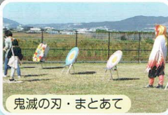
鬼滅の刃・まとあて