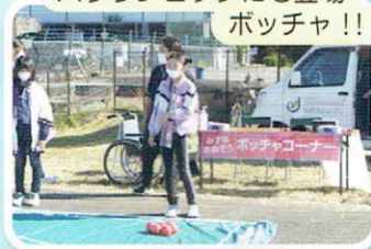
パラリンピックにも登場 ポッチャ!!