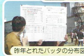
昨年とれたバッタの分布図