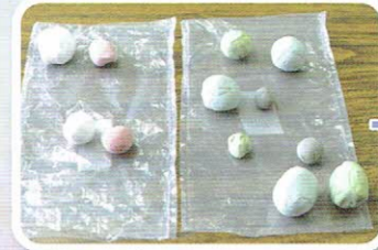
やわらかくて扱いやすい 樹脂粘土