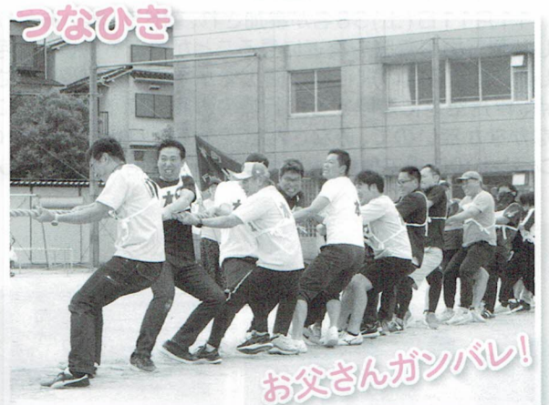
お父さんガンバレ!