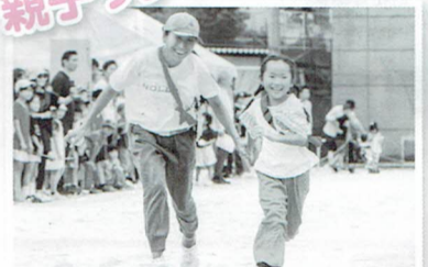
笑顔でバトンタッチ