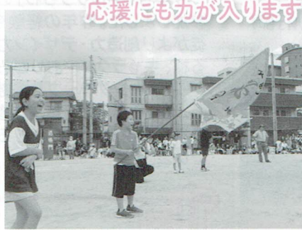
応援にも力が入ります