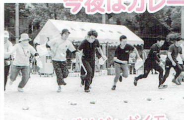
まずはジャガイモ