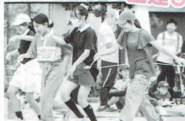
「落とさないように速く」がむずかしい