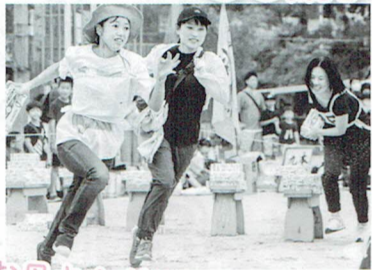
お母さんガンバレ!