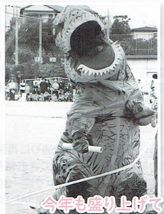
今年も盛り上げてくれました

今年度の地区体育祭は、4年ぶりにフルバージョンで開催いたしました。前夜から朝方まで雨が降り、屋外での開催が危ぶまれましたが、皆さまにグラウンドの水たまりの除去作業にご協力いただき、無事屋外で開催することができました。早朝からありがとうございます。