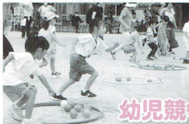
幼児競争 何色のボールがいいかな?