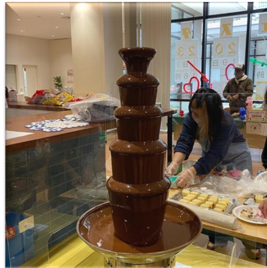
ショコラファウンテン